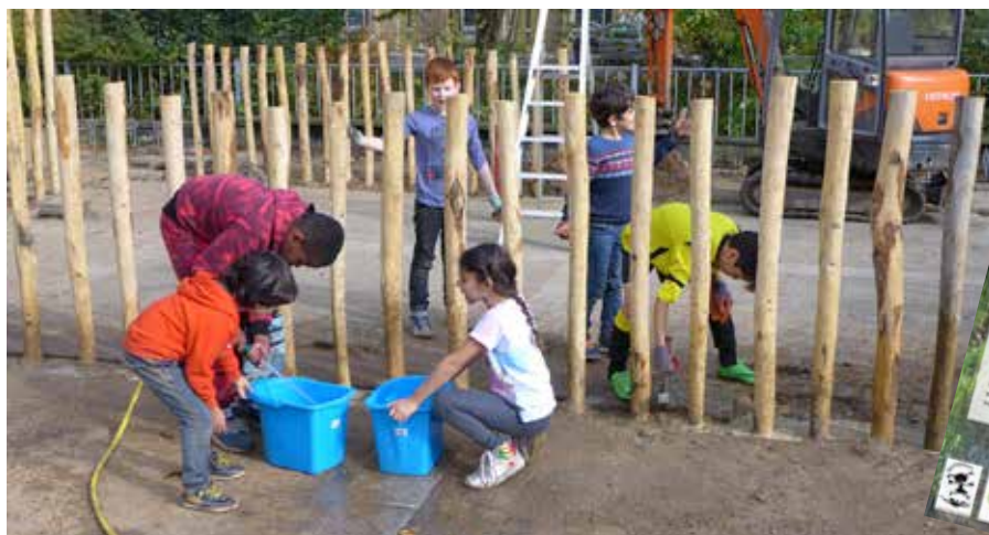
Ook scholen worden geadviseerd bij het vergroenen van hun plein