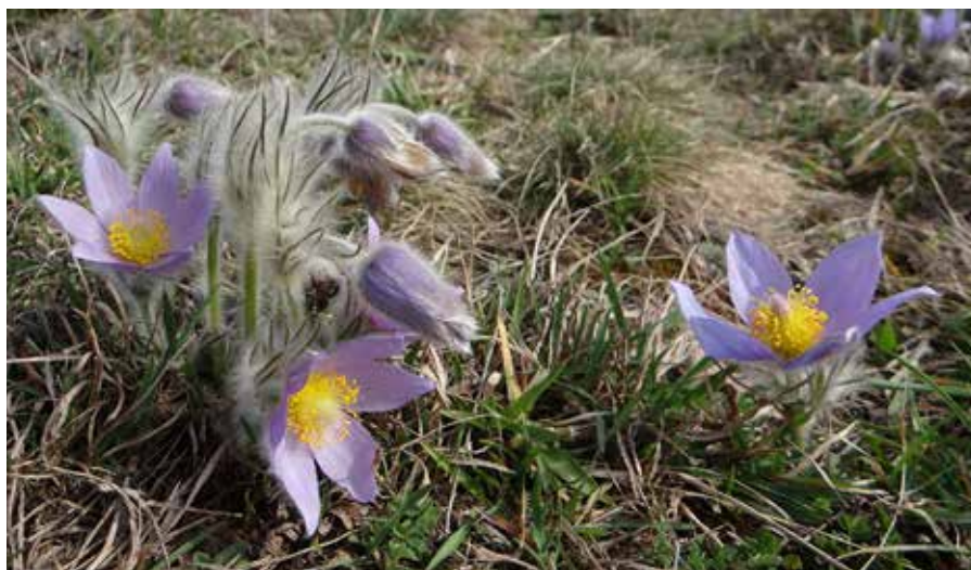
Wildemanskruid is uit ons land verdwenen, deze groeiplek is in Tsjechië

melen zal plaatsvinden op basis van heldere protocollen. Sommige planten zijn namelijk inmiddels al zo zeldzaam dat zelfs het verzamelen van zaden al gevaarlijk kan zijn voor het voortbestaan van de populatie.