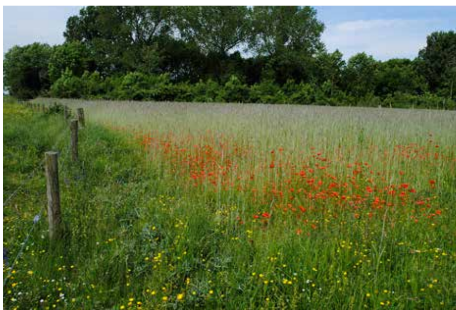
Akkerflora in een reservaat nabij Brummen

in Nederland uitgestorven en we kunnen ze niet meer terugbrengen. Wel kunnen we van deze soorten materiaal verzamelen in het buitenland, maar dan weten we niet of het dezelfde genetische vormen betreft als van onze eigen vroegere populaties. Vermoedelijk is dat niet het geval. Het authentieke genetische materiaal is belangrijk, omdat dit de planten zijn die zich in onze omgeving hebben ontwikkeld met hun specifieke plek in het ecosysteem. Dit is een intrinsieke waarde, van de oorspronkelijkheid van de natuur van ons eigen laagland. Het verza-