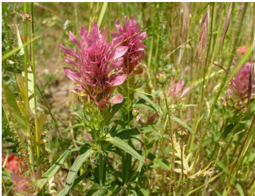
Wilde weite in Heemtuin de Goffert

dus deels teruggaan naar de Nationale Zaadcollectie en deels worden ingezet voor uitzaaï en verdere kweek.