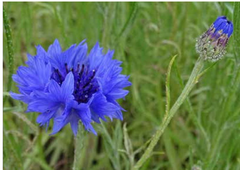
Links: wilde korenbloem, de bloemen zijn veel ijler dan bij de 'foute' korenbloem (rechts) die vaak in mengsels opduikt

ten koste van onze inheemse wilde planten. Alle goede bedoelingen ten spijt, maar al die vaak doorgekweekte planten van zaden betrokken uit het buitenland vormen een bedreiging voor de genetische en regionale identiteit van onze eigen bolderiken, margrietten, rolklavers en korenbloemen.