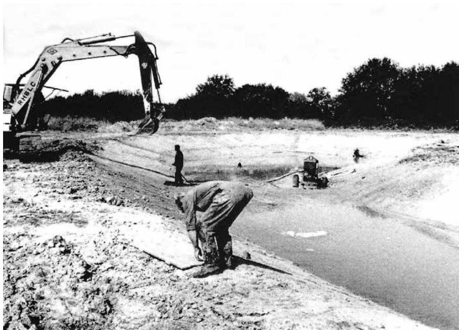
< Tijdens de aanleg

en verrees voor de voorgevel een fraai begroeide rotsplantenmuur van baksteen, mergelblokken, lava en tufsteen. In de spleten en holtes overwinteren vlinders, nestelen vogels en schuilen vleermuizen. Ook is met subsidie een Tasberg, een hooimijt naar West-Brabants model, gebouwd.