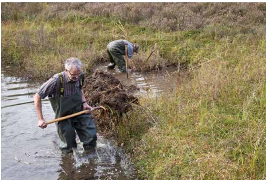
Onderhoud aan de waterpartijen