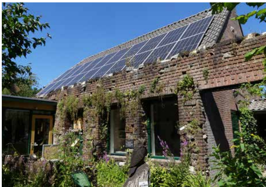
Ut Gebouwke met rotsplantenmuur en zonnepanelen

In 2007 werd Ut Gebouwke grondig verbouwd met Europese subsidie