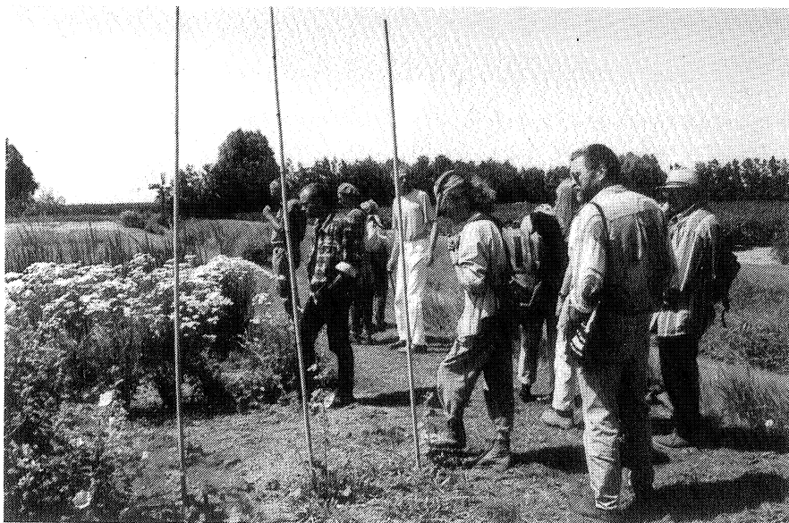
Wilde Weelde - excursie bij "De Bolderik", Wervershoof

Bloeiend en boeiend zijn niet alleen de openbare heemtuinen, maar zeker ook de natuurlijke tuinen rondom scholen.