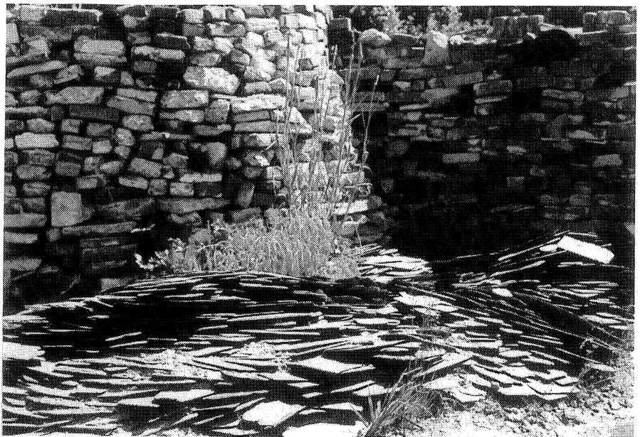
Hergebruik van kloosterstenen en kerkdakleien in de Oase-tuin

Heemtuin Malden om de vijfhonderd inheemse boompjes en struiken te planten, volgens een plan van Paul van Eerd. In de vijver stond inmiddels water, maar het was duidelijk dat we er niet onderuit zouden komen er een ondoordringbare laag in aan te brengen. Eén ding stond vast: het mocht geen vijfverplastic worden. We zochten dus naar een milieuvriendelijker alternatief. We realiseerden ons dat wij niet de enigen zouden zijn die voor dit probleem een oplossing zochten en organiseerden daarom een studiedag met als thema: "Natuur- en milieuvriendelijke vijfverafdichting." Aan de kwaliteit van de voordrachten lag het beslist niet, maar aan het eind van de studiedag waren we, wat een beslissing betreft, net zo ver als er voor. We hakten de knoop door na een telefoontje van Leo Steenbergen van De Keltenhof, die de vijvers in zijn voorbeeldtuinen met EPDM had afgedicht en daar positieve verhalen over vertelde.