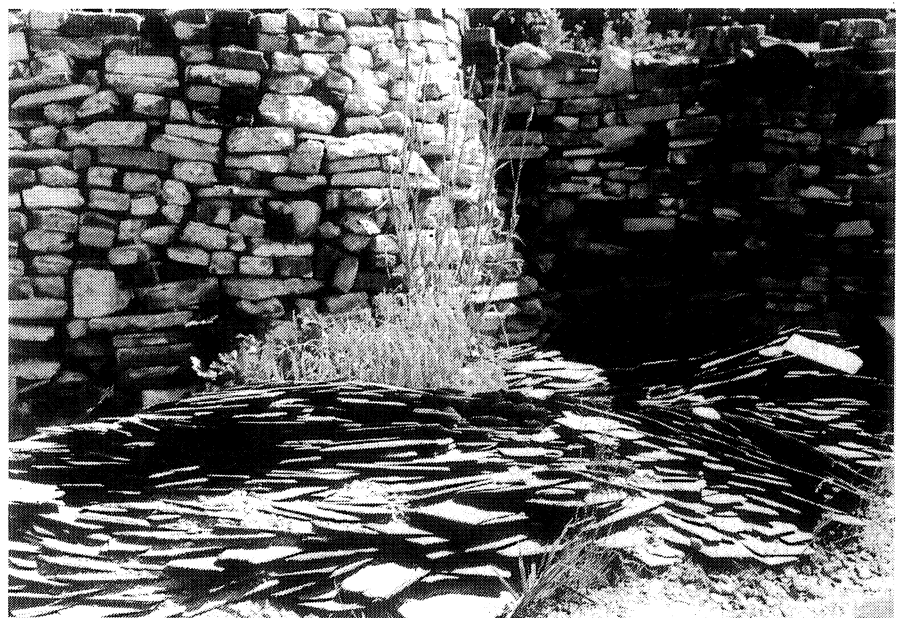
Leiplatenreliëf voor de donjon

Het vennetje blijft na vulling met tientallen gieters water tot nu toe zwart en algenvrij. Het blijkt wel van het begin