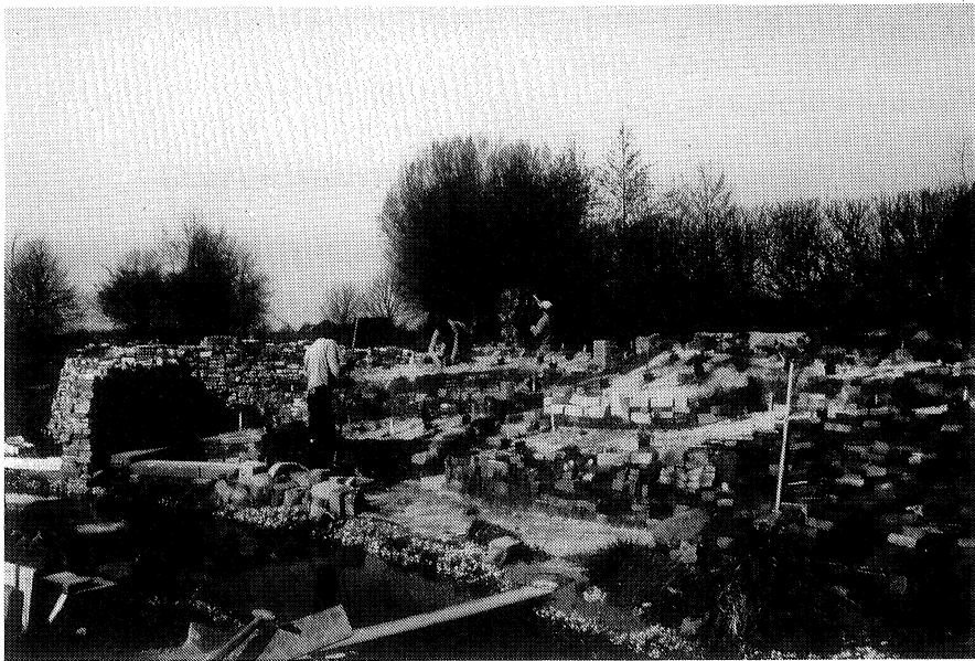
Het torentje is bijna klaar, de eerste planten zitten in de grond

der in het voormalige gymzaaltje van ons klooster gesloopt. Een container vol mooie oude stenen stond voor onze deur, en we konden voorkomen, dat deze zijn normale bestemming bereikte: een puinverwerkingsfabriek in Nijmegen. En bij Loes van der Meij in Malden mochten we een vrachtje dakpannen e.d. komen halen.